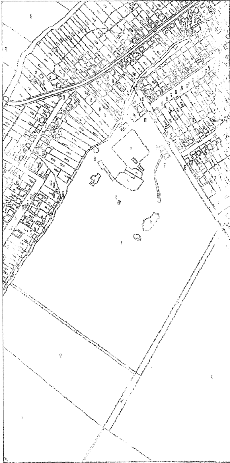
Príloha č. 1