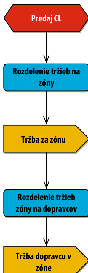
Obr. 1 Obecný postup delby tržieb z CL