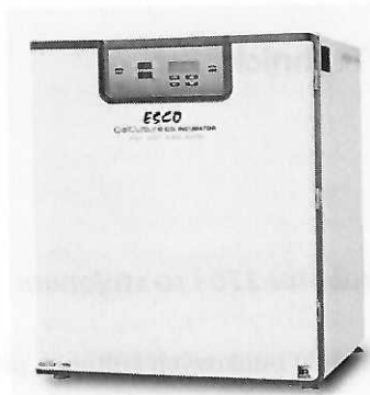
Obr. 1: CelCulture inkubátor 170 I