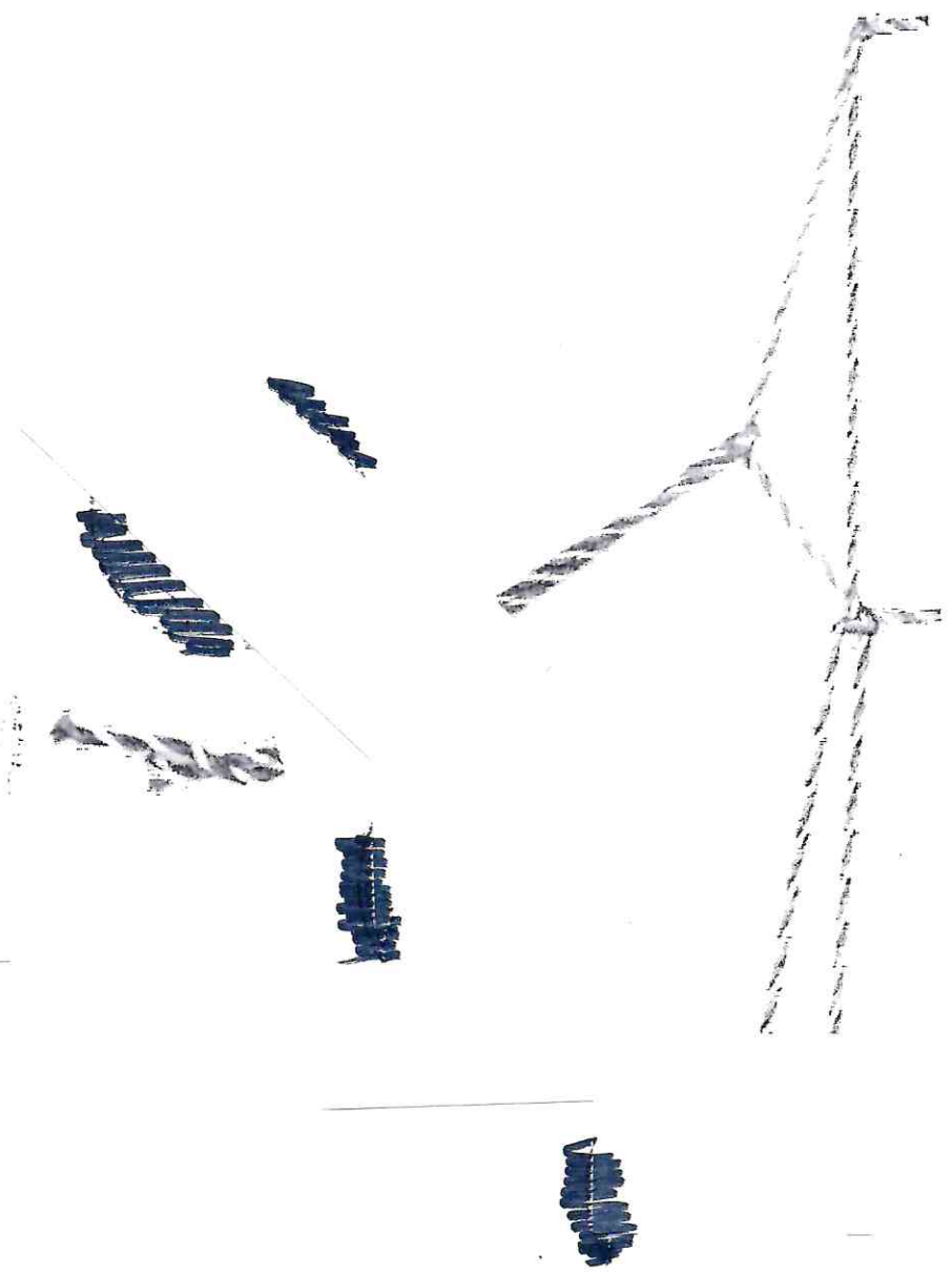
EXHIBIT 101 [Illegible text with several lines of blacked-out redactions]