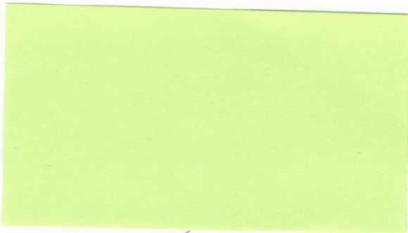
Obecný úrad (Objednávateľ odpadu)