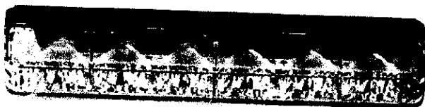
Obrázok 1 Ilustračný obrázok - zábleskové LED svetlá v prednej maske