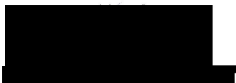
vedúci oddelenia poistenia flotil Allianz – Slovenská poisťovňa, a. s.

Národná agentúra pre sieťové a elektronické služby