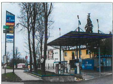
ČS Suhovská, Trnava