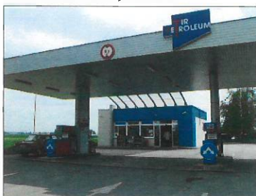
ČS Koniarekova, Trnava