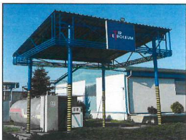
ČS Nitrianska, Trnava