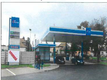
ČS A. Kmeťa, Trnava