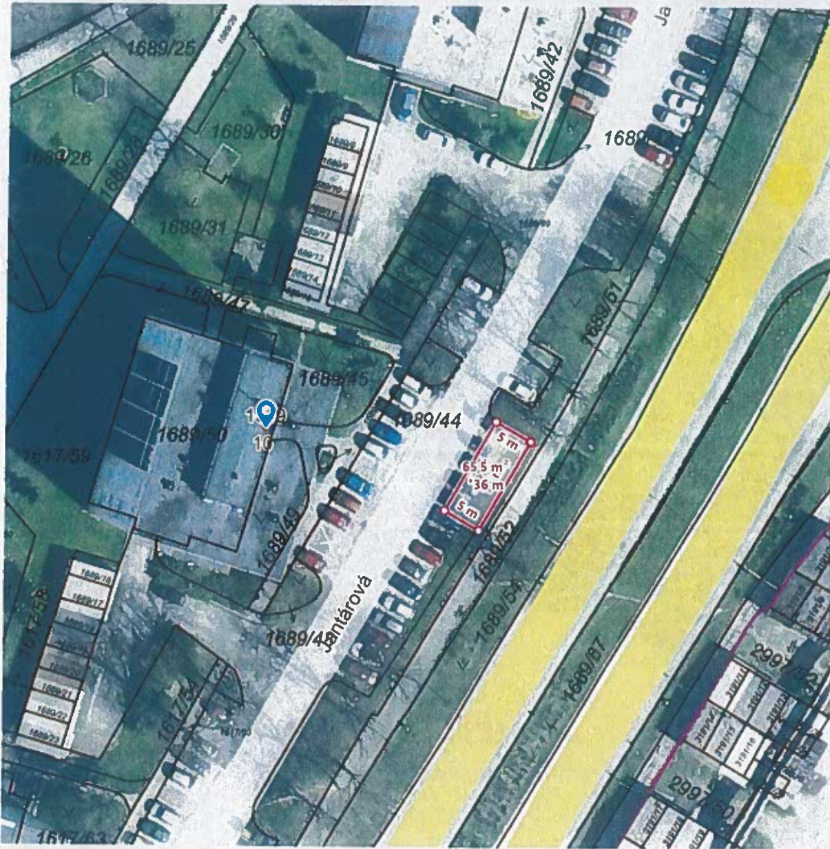
Jantárová 10, parcela „C“ 1723/39 k.ú. Skladná, LV č. 10527