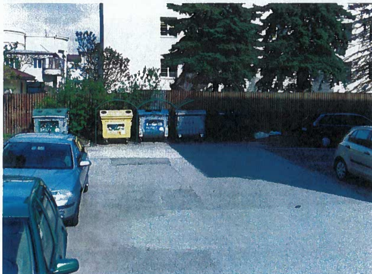
Pri nemocnici 10