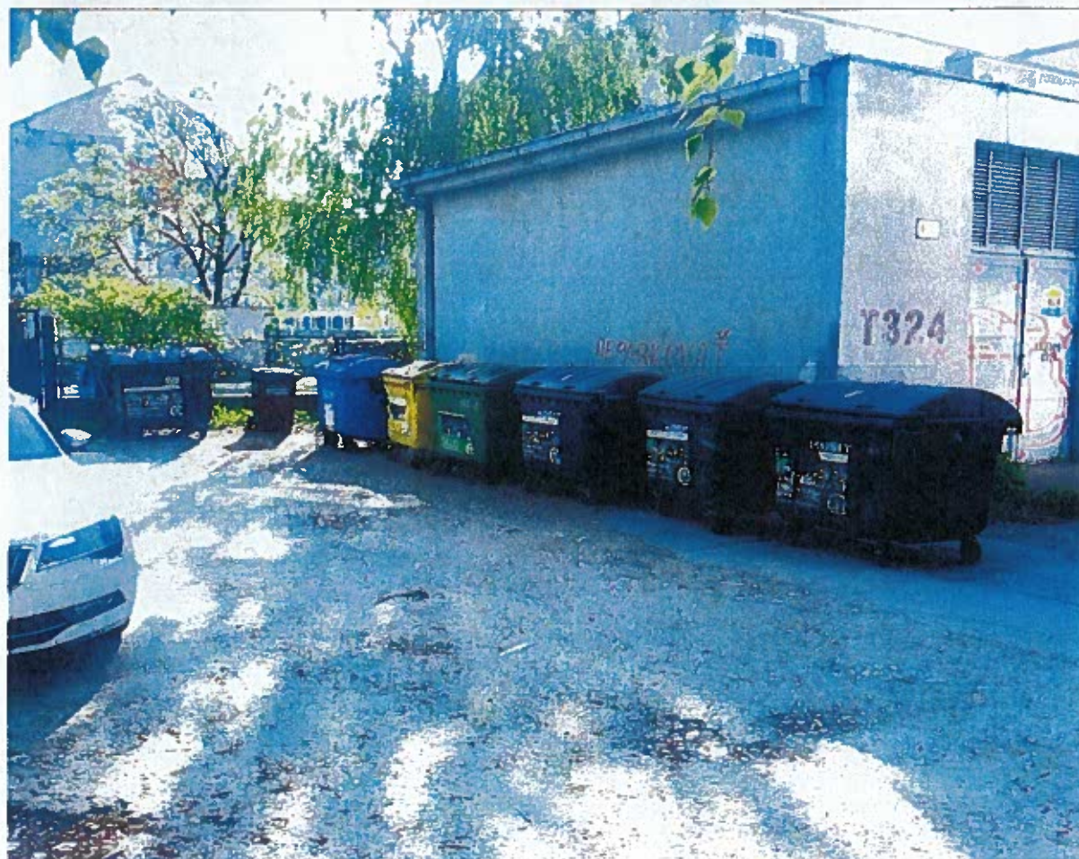
Zborovská 4 dvor