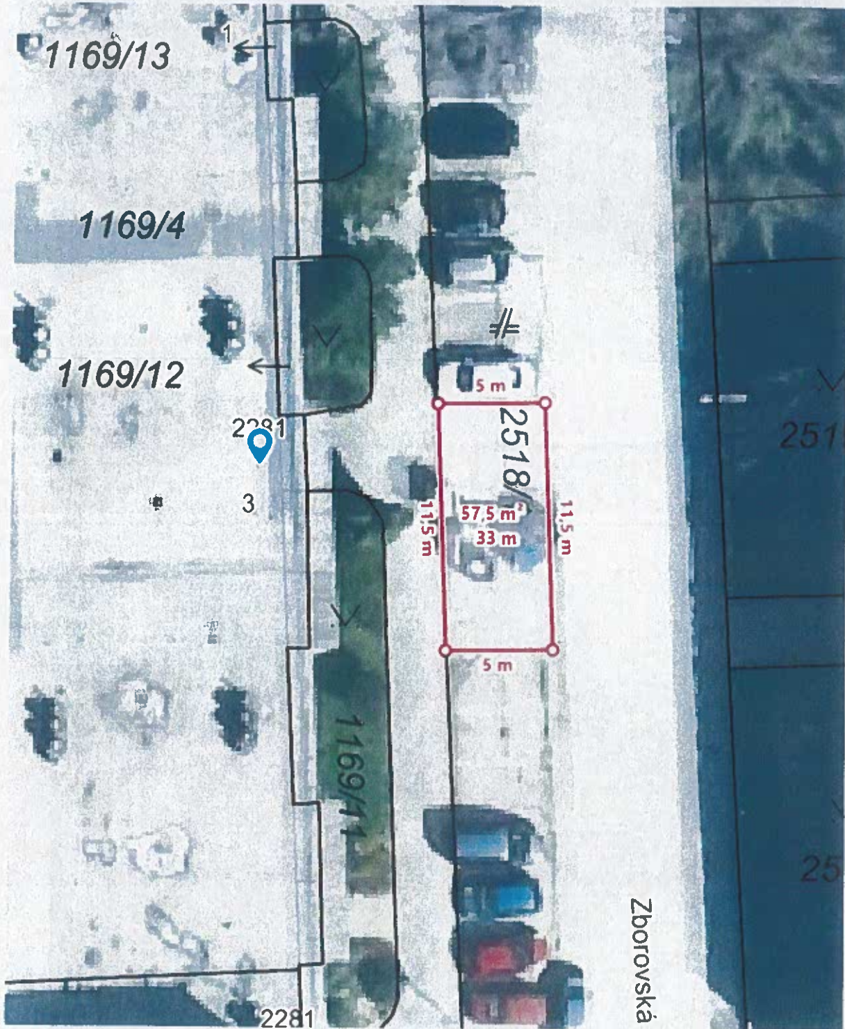
Zborovská 3, parcela „C“ 2518/1 k. ú. Skladná, LV č. 10527