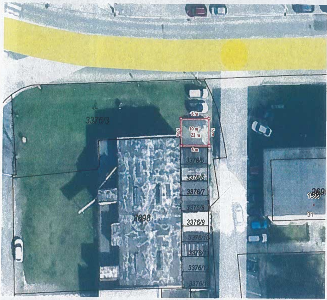
Južná trieda, parcela „C“ 3376/3 k.ú. Južné mesto , LV č. 11650