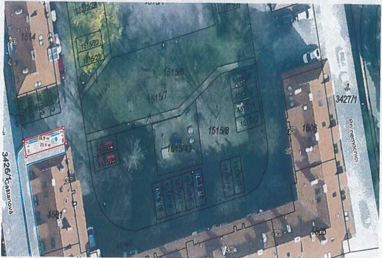
Gaštanová 4, parcela „C“ 1516/4 k.ú. Južné mesto , LV č. 11650