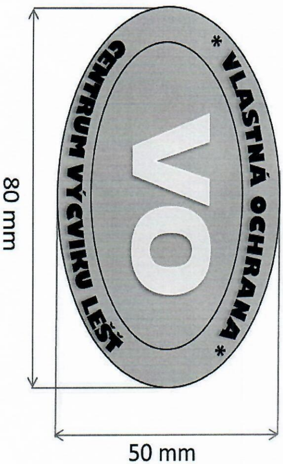
Nášivka - znak VO