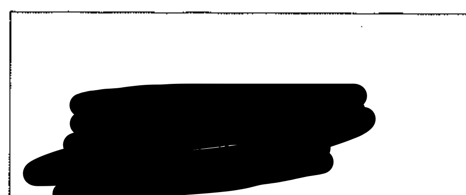
Podpis oprávneného zástupcu poisťovateľa (odtlačok pečiatky)

Získateľské číslo oprávneného zástupcu poisťovateľa 1