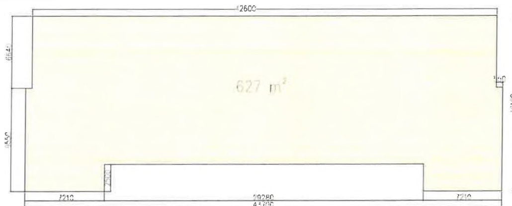
PODLAHOVÁ PLOCHA PODLAŽIA ZÁKLADNÁ ŠKOLA CÍFER

Podlahová plocha podlažia : 627 m 2 Počet podlaží : 4 Celková podlahová plocha : 2508 m 2