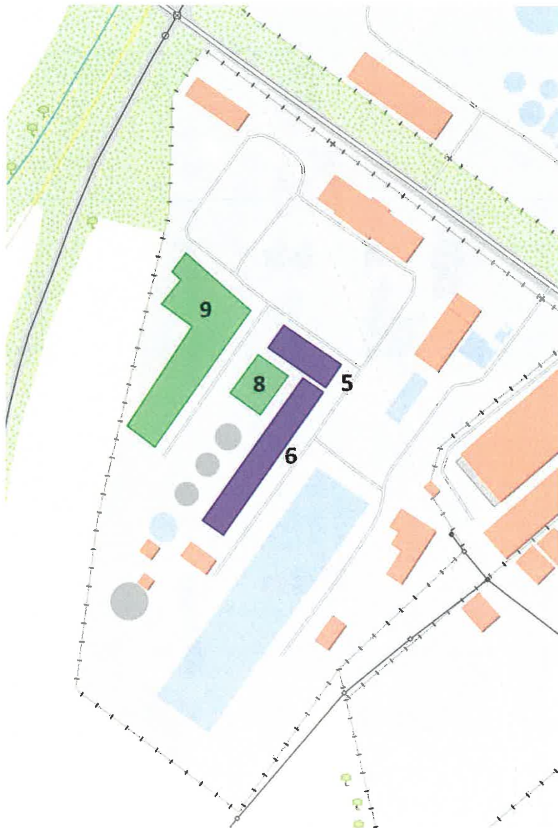
Obrázok č. 2: Areál ČOV Senica