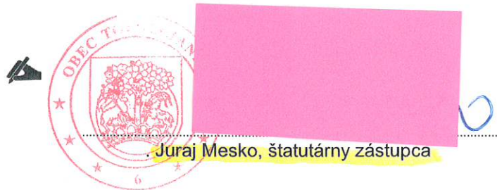
Juraj Mesko, štatutárny zástupca