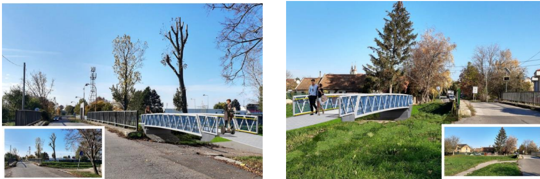
Rozsah zákazky (stavebné práce):

Obrázok č. 2, 3 – Vizualizácia navrhovanej stavby - Lávka pre peších a cyklistov pri ZŠ a MŠ Modranka