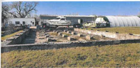
Pozemok č. 1667/4