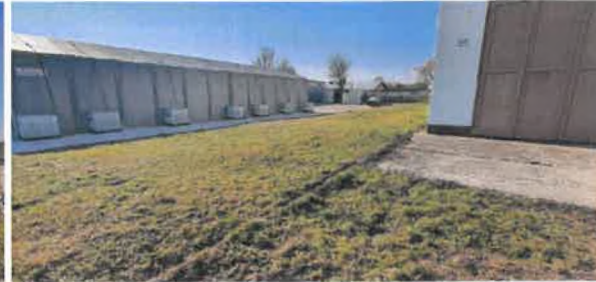
Pozemok č. 1667/24