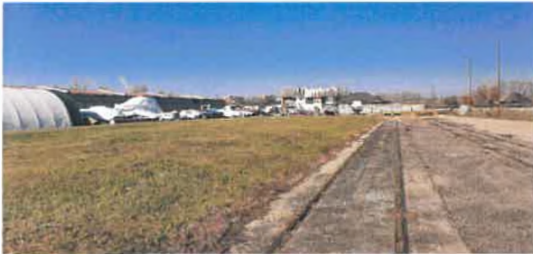
Pozemok č. 1667/17