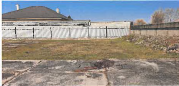
Pozemok č. 1667/16