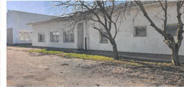
Pozemok č. 1667/23