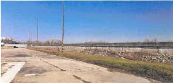
Pozemok č. 1667/19