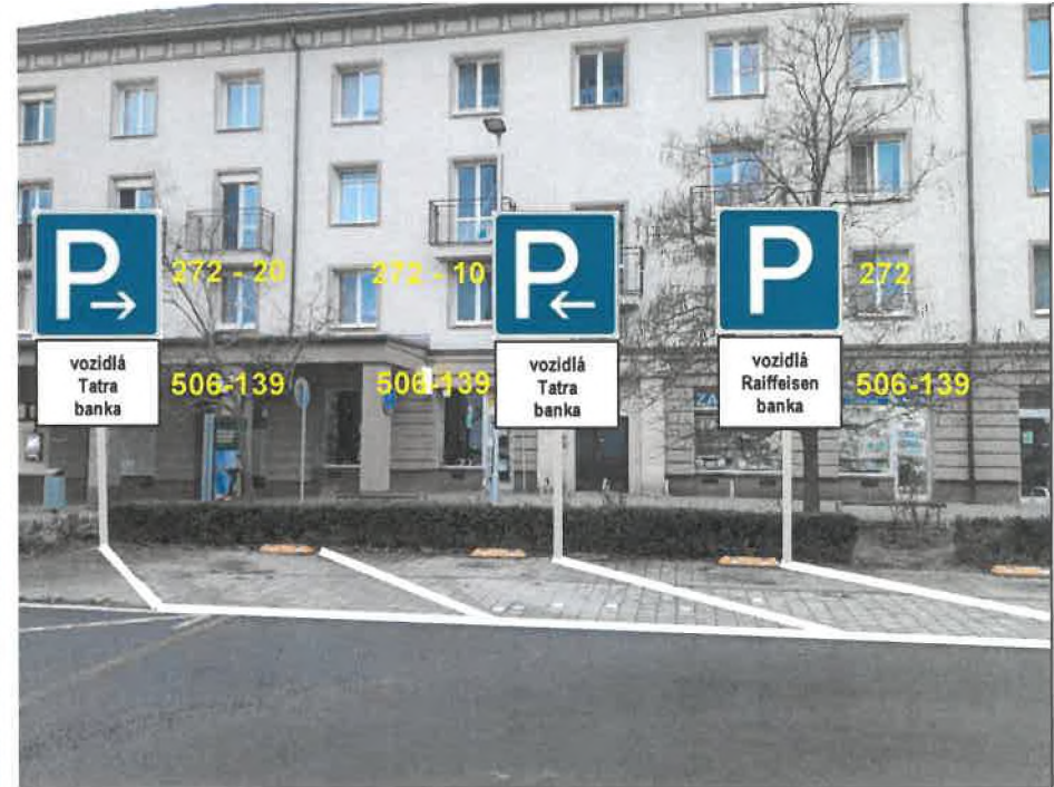
Príloha č. 1 – náčres vyznačenia vyhradených parkovacích miest.