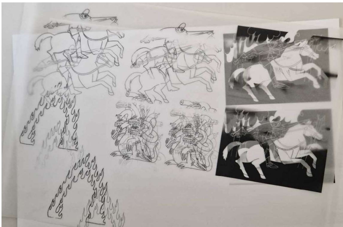
Obrazová príloha – ilustrácie Jozefa Gl'abu – Popolvár