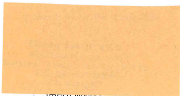
Imrich Nedera za zhotoviteľa