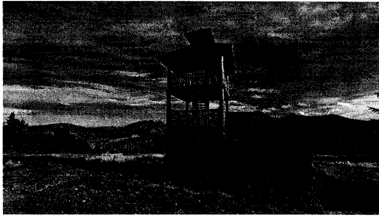
Turistická rozhľadňa Machy.jpg