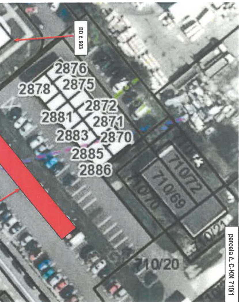
Príloha č. 1 – situácia