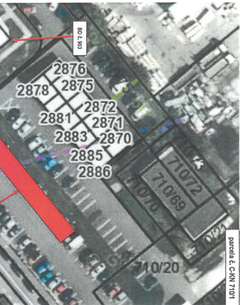
Príloha č. 1 – situácia