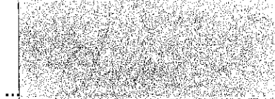
Jaroslava Bergendlová starostka Za Objednávateľa

OBEC Kráľová nad Váhom 925 91 Kráľová nad Váhom 71 IČO: 00 306 070 DIČ: 2021024016