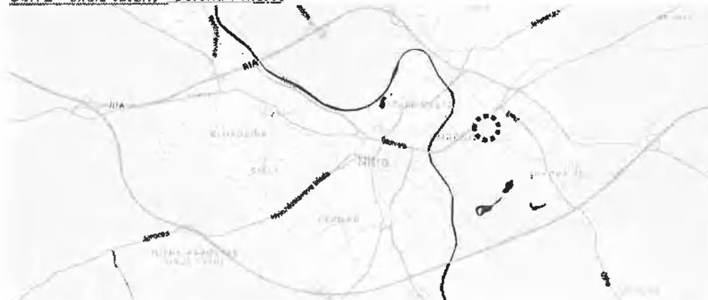
Obr. 3 – riešené / existujúce objekty -- na podklade katastrálnej mapy