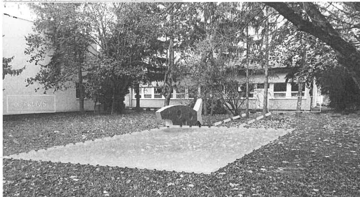
Obr. 1 – fotografia – zakres navrhovanej polohy objektu

Taktiež záväzným termínom je lehota vyplývajúca z výzvy plánu obnovy a odolnosti (POO) a to 31.8.2024, kde je nutné predloženie právoplatného stavebného povolenia.