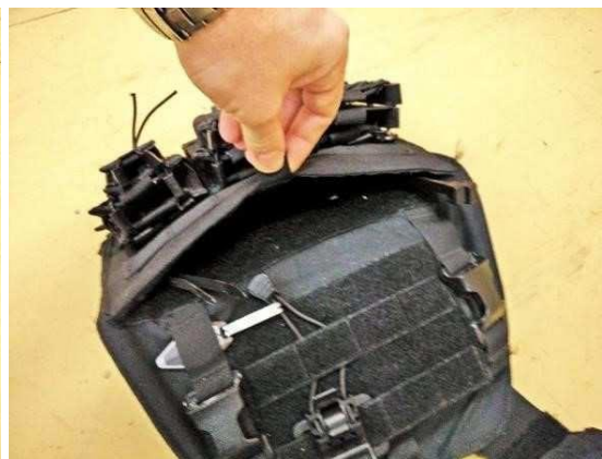
Obrázok č. 9