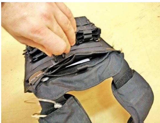
Obrázok č. 8

Šírka pásu suchého zipsu dolného vrecka: 38 \pm 5 mm.