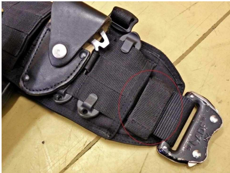
Obrázok č. 15

Na lepšie upevnenie opasku v návleku sú použité 4 vodiace pútka o šírke 20 mm ± 2 mm. Krajné pútka (Obrázok č. 15) sa nachádzajú čo najbližšie ku kraju návleku a sú zapínateľné suchým zipsom. Ostatné pútka sú rovnomerne rozmiestnené v návleku tak, aby boli skryté pod tretím panelom od kraja návleku.