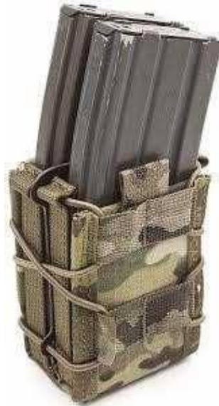
Obrázok č. 19