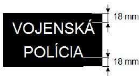
Obrázok č. 4

Centrovanie každého slova v horizontálnom smere je na stred nášivky. Vzdialenosť slova „Vojenská“ (diakritika sa tu neberie do úvahy) je 18 mm od horného okraja nášivky. Vzdialenosť slova „POLÍCIA“ je 18 mm od dolného okraja nášivky (Obrázok č. 4).