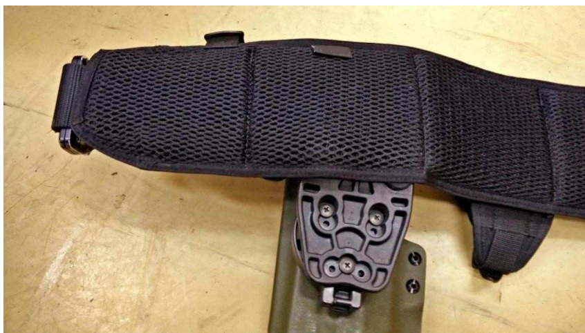
Obrázok č. 13

Návlek je vyrobený z rovnakej tkaniny ako vesta. Vnútorňa strana návleku je polstrovaná a opatrená materiálom s 3D štruktúrou (Obrázok č. 13).