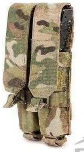
Obrázok č. 20

Sumka na kovové policajné putá s príklopkou: jeden kus na vestu.