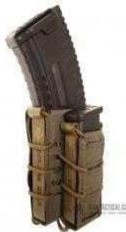
Obrázok č. 18