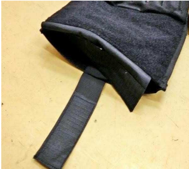
Obrázok č. 6

Vesta obsahuje veľké vrecko v prednom aj zadnom diely, ktoré vyplňa vnútro celého dielu. Rozmer vnútorného vrecka: šírka: 275 \pm 5 mm, výška: 335 \pm 5 mm, tvar vrecka: obdĺžnik. Otvárateľné je zdola. Uzatvárateľné suchým zipsom po celej dĺžke otvoru. Šírka suchého zipsu: 38 \pm 5 mm. Na vnútornej stene vrecka sa v strede nachádza pevný popruh o šírke 50 mm opatrený suchým zipsom (háčik), ktorý sa uchytáva k protíľahlej vnútornej stene, ktorá je opatrená suchým zipsom (vlas). Slúži na fixáciu uložených predmetov proti náhodnému vypadnutiu a pohybu (Obrázky č. 6 a 7).