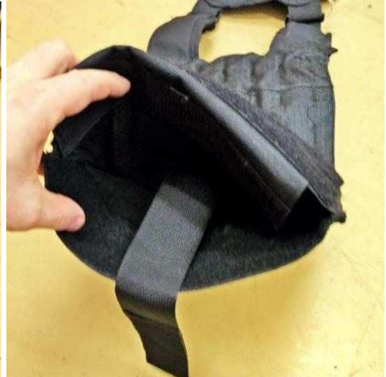
Obrázok č. 7

Na prednom diely vesty sa nachádzajú dve skryté vrecká.