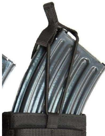
Obrázok č. 16

Zabezpečenie každého zásobníku a aj vysielačky cez gumku (Obrázok č. 16).