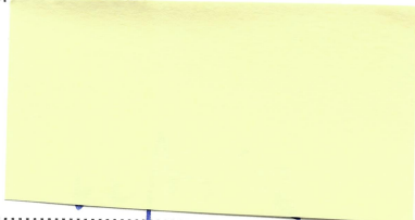
Ladislav Kamenický minister

V Bratislave, dňa 20.03.2024 (ak sa podpisuje elektronicky, za dátum podpisu zmluvnou stranou sa považuje dátum vyplývajúci z kvalifikovanej elektronickej časovej pečiatky pripojenej k autorizácii oprávnenej osoby)