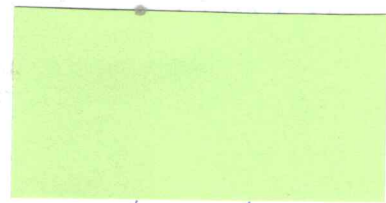
za nájomcu Ľubica Šimunová