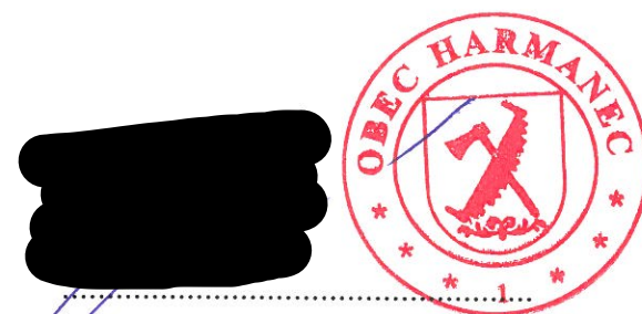
starostka obce Harmanec