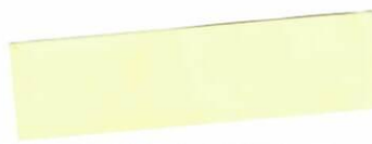
Firma / meno priezvisko zákazníka Obec Slavec