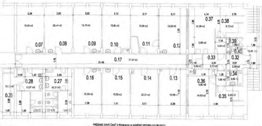
PRÍZEMIE ČIARÁ ČASŤ Z POHĽADU HLAVNÉHO VSTUPU DO OBJEKTU