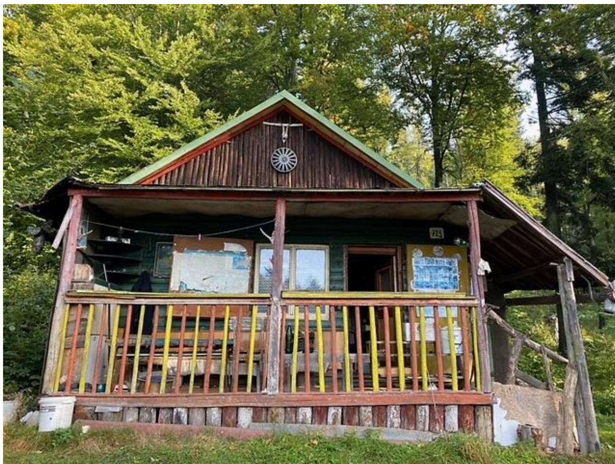
Príloha č. 3 – Fotodokumentácia predmetu nájmu