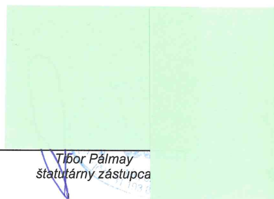
Tibor Pálmay štatutárny zástupca