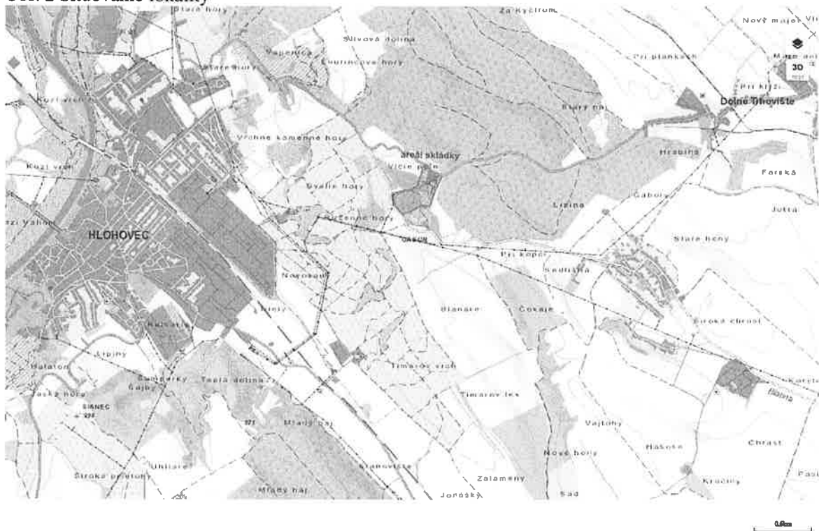
Obr. 2 Situovanie lokality

Geologické prostredie lokality je budované kvartérnymi sedimentmi predovšetkým eolického pôvodu, t. j. sprašami, v ktorých prevládajú sprašové hliny (flovité silty) až silty, so sporadickými šošovkami siltových pieskov, častokrát vápnité. Hrúbka kvartérneho pokryvu v bezprostrednom okolí skládky dosahuje do 14,5 m.p.t., pričom dokumentované šošovky siltových pieskov až strednozrnných pieskov dosahujú hrúbky do 3 m. Neogénne podložie predstavujú predovšetkým fly, menej piesky.