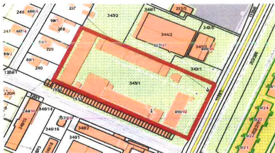
Obrázok 17 Svidník – oblastné riaditeľstvo