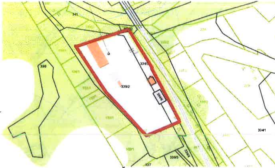
Obrázok 19 Šemetkovce - vysunuté pracovisko