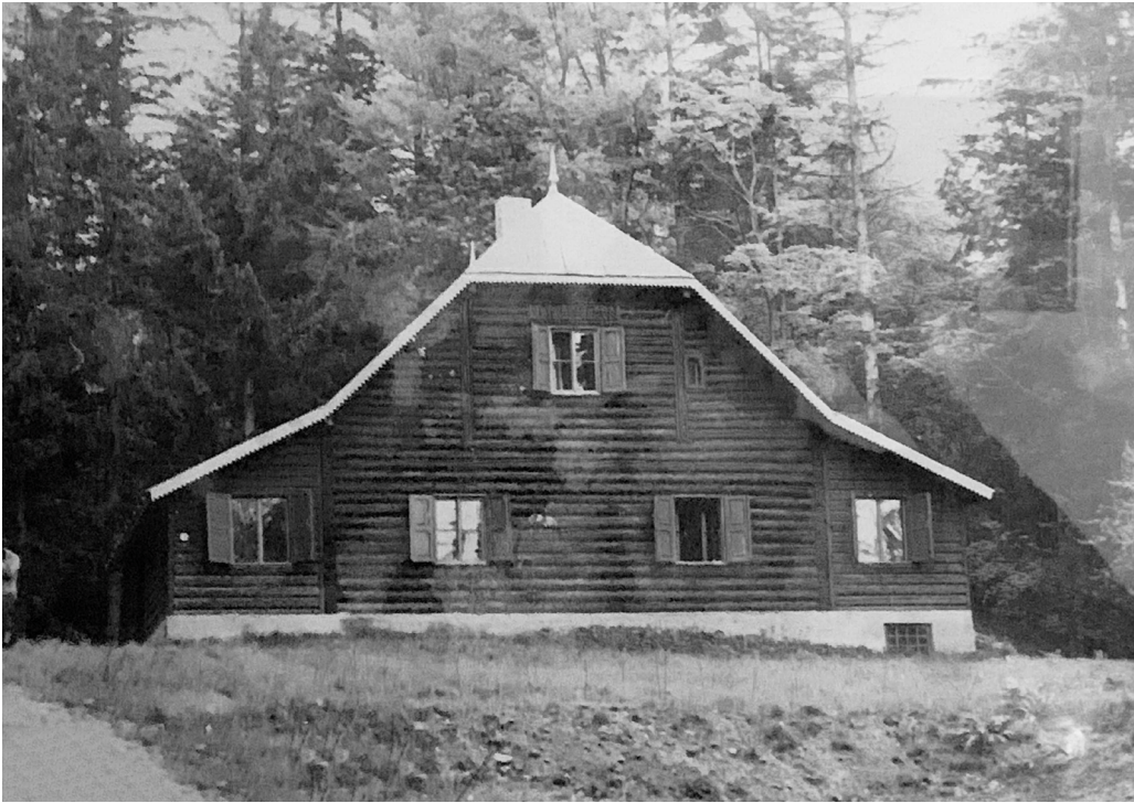
Chata, ktorá bola zničená 27.12.1996