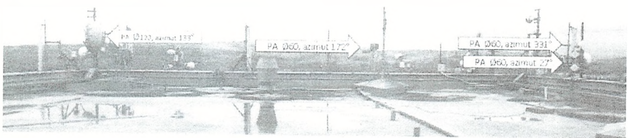
Časť projektu stavby „Distribúcia modulácie pre DTV vysielače TVP Prešov RR medzibod FNŠP J.A.Reimana v Prešove“, investor Towercom, a.s., Bratislava