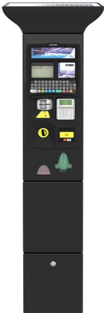
Pozn.: Ilustračný obrázok