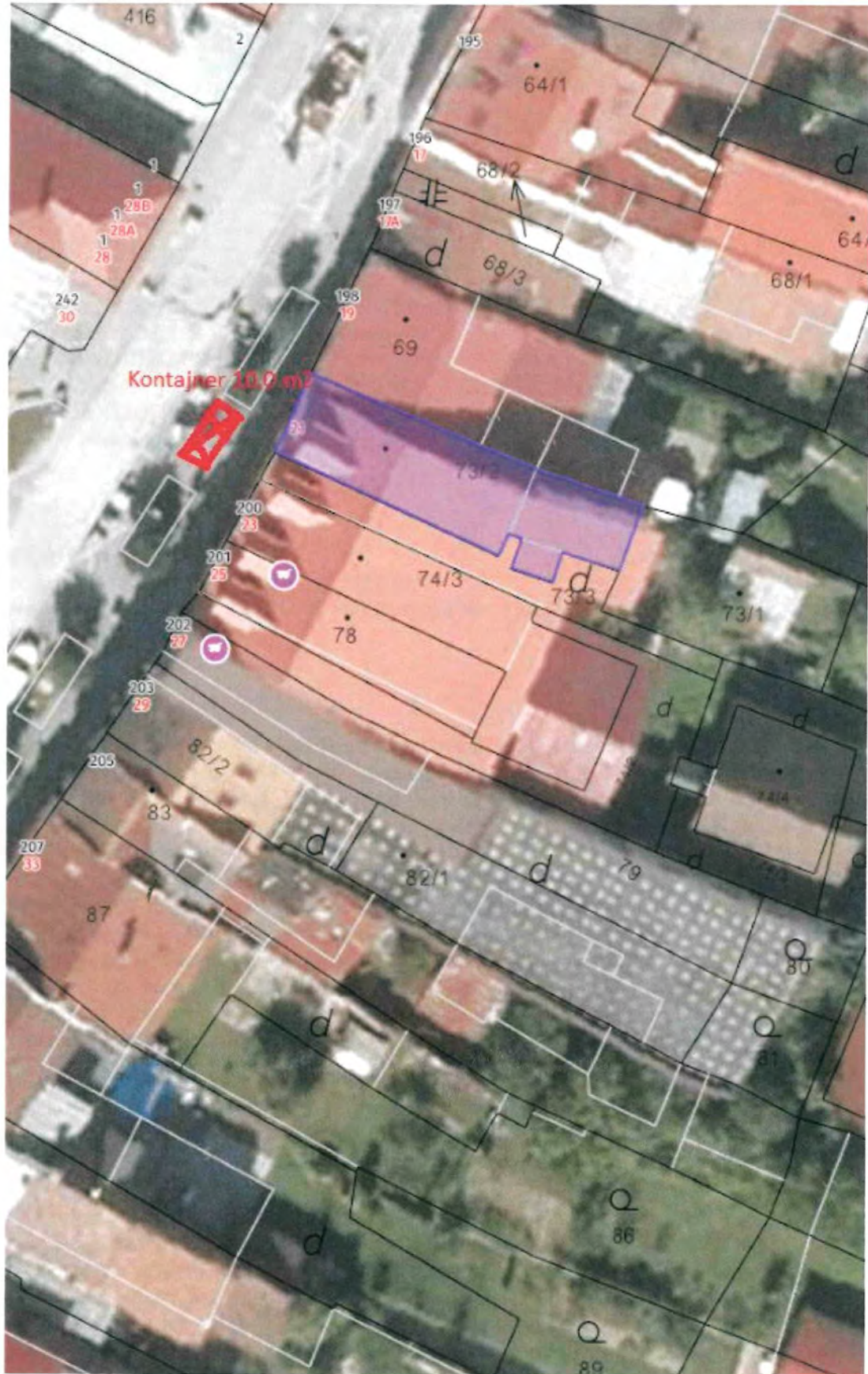
Príloha č. 1 – situačná snímka