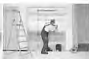
Servis 24 hodín