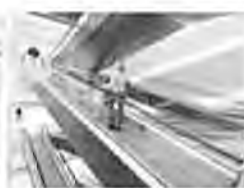
Eskalátory & pohyblivé chodníky