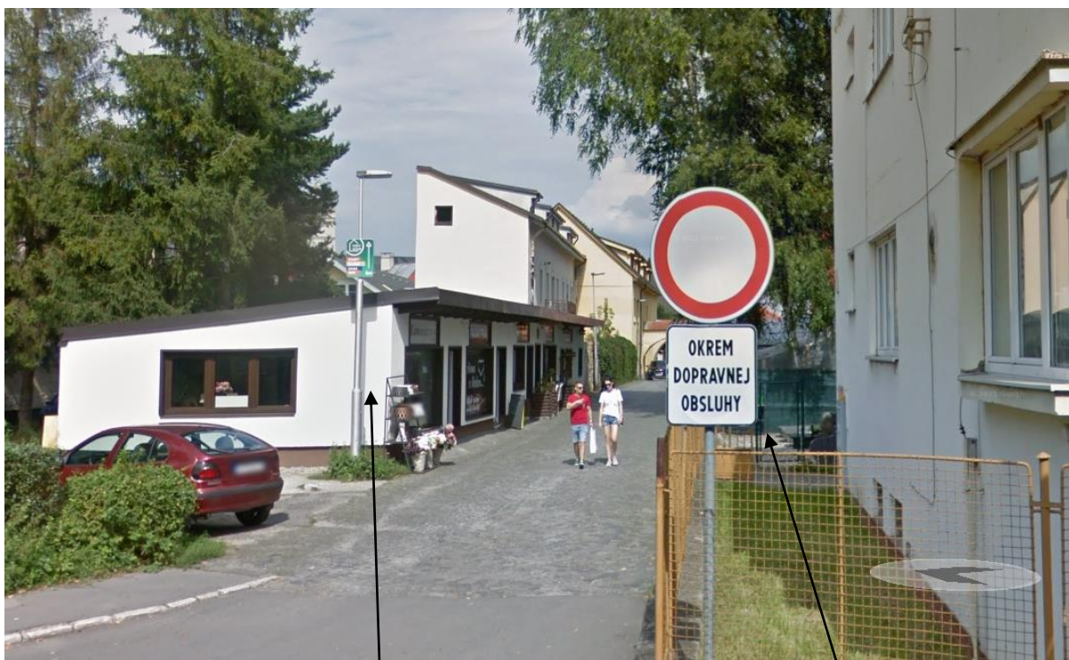
Kamenárstvo - ZOSTAV s.r.o.