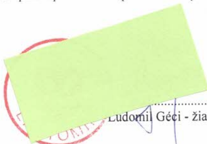
..... Ľudomil Géci - žiadateľ