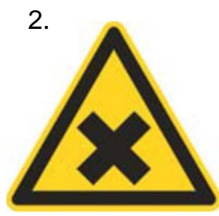
Nebezpečenstvo škodlivej alebo dráždivej látky