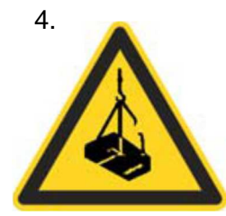
Nebezpečenstvo pádu alebo pohybu zaveseného bremena