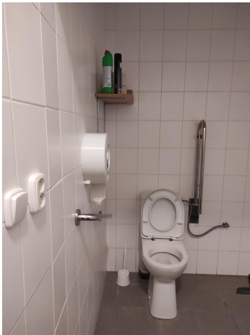
Súčasnú riešenie bezbariérovej toalety