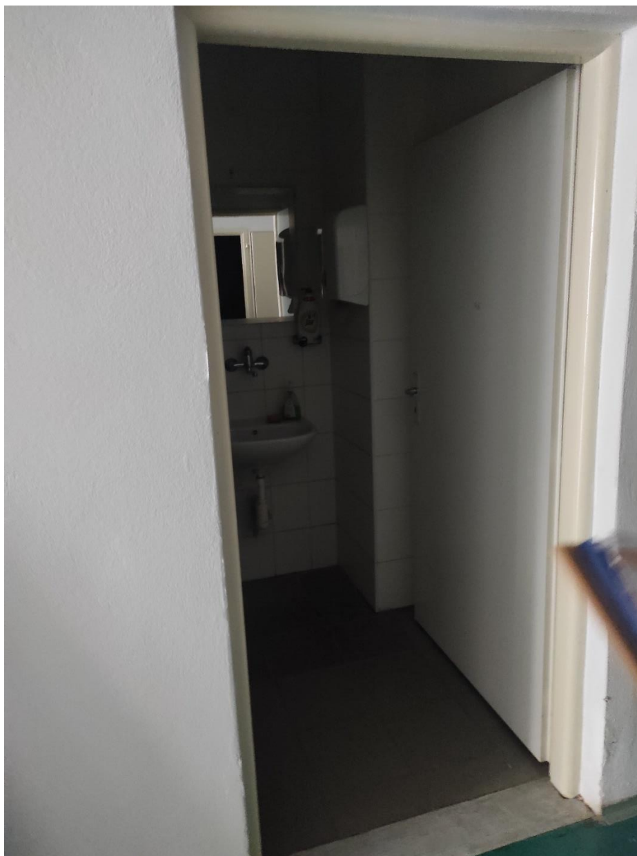
Súčasnú riešenie bezbariérovej toalety