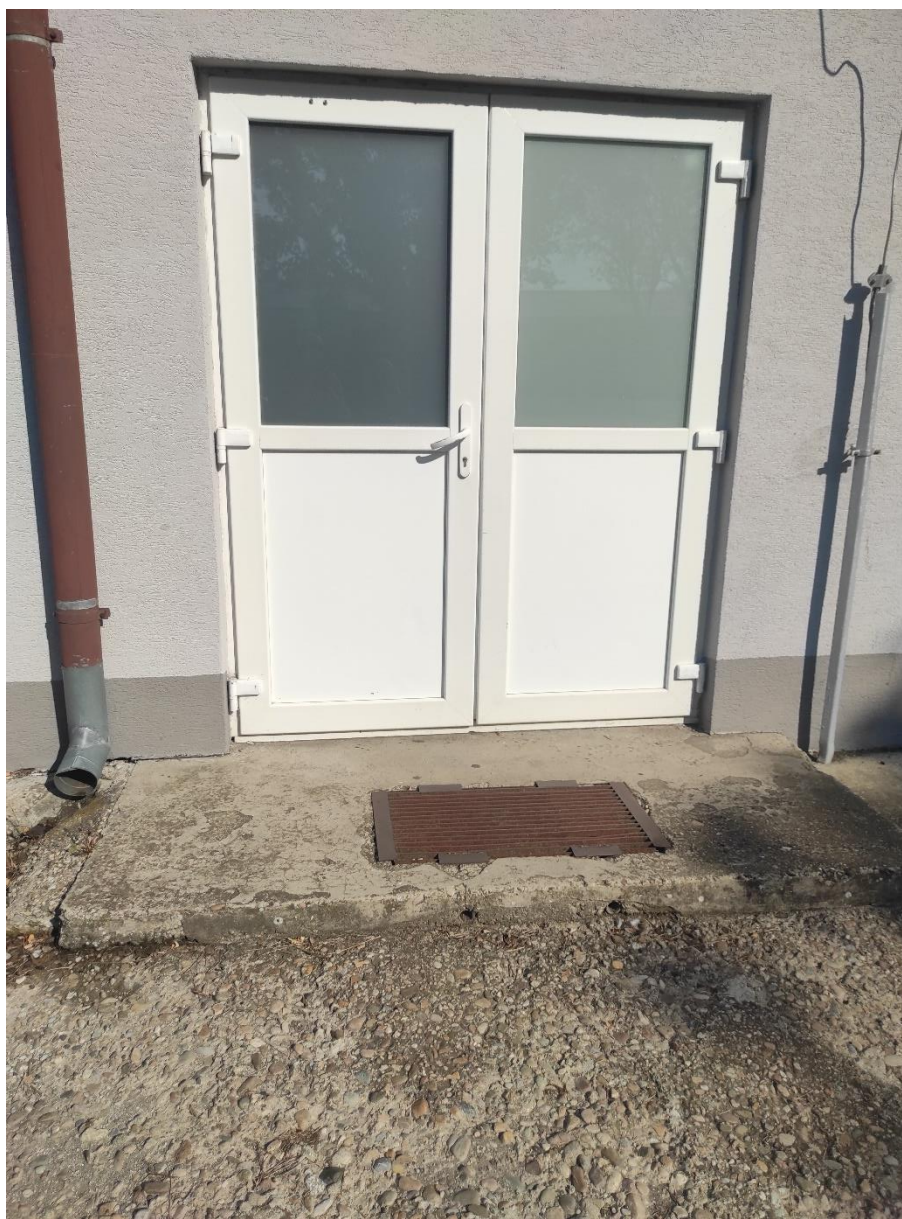
Vstup do telocvične