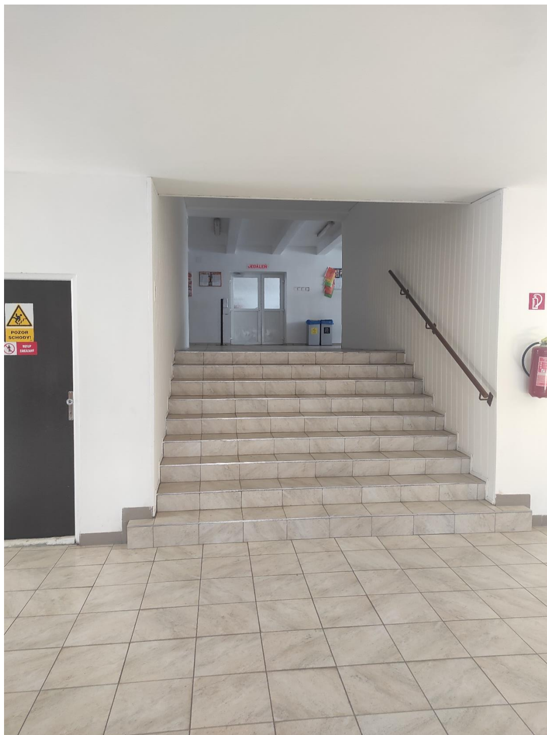
Schodisková plošina do jedálne