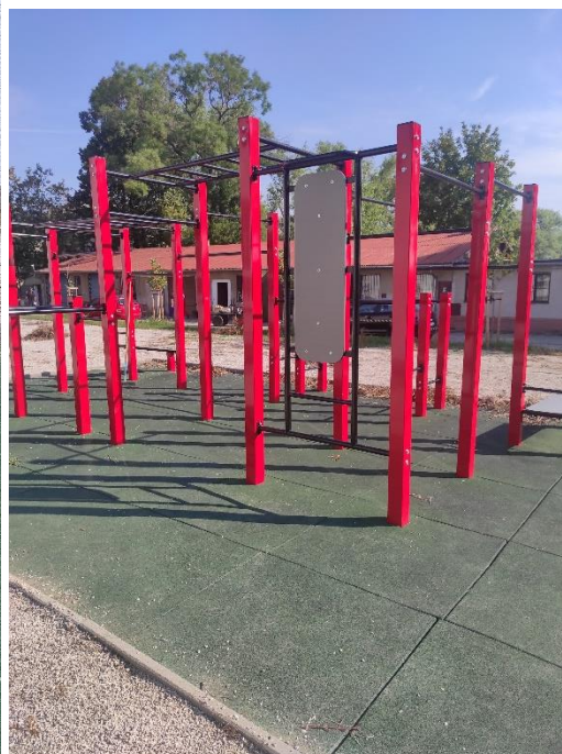
Prístup na k workoutovému ihrisku