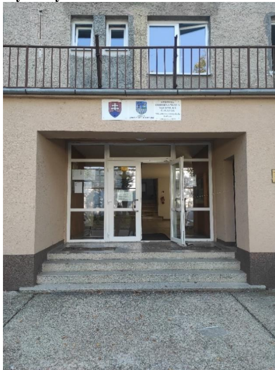
Hlavný vstup do budovy školy