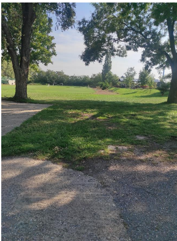
Prístup na ihrisko