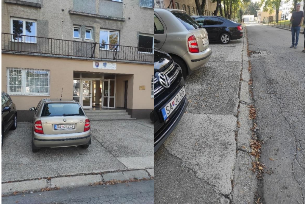
Parkovisko pred hlavným vstupom do budovy