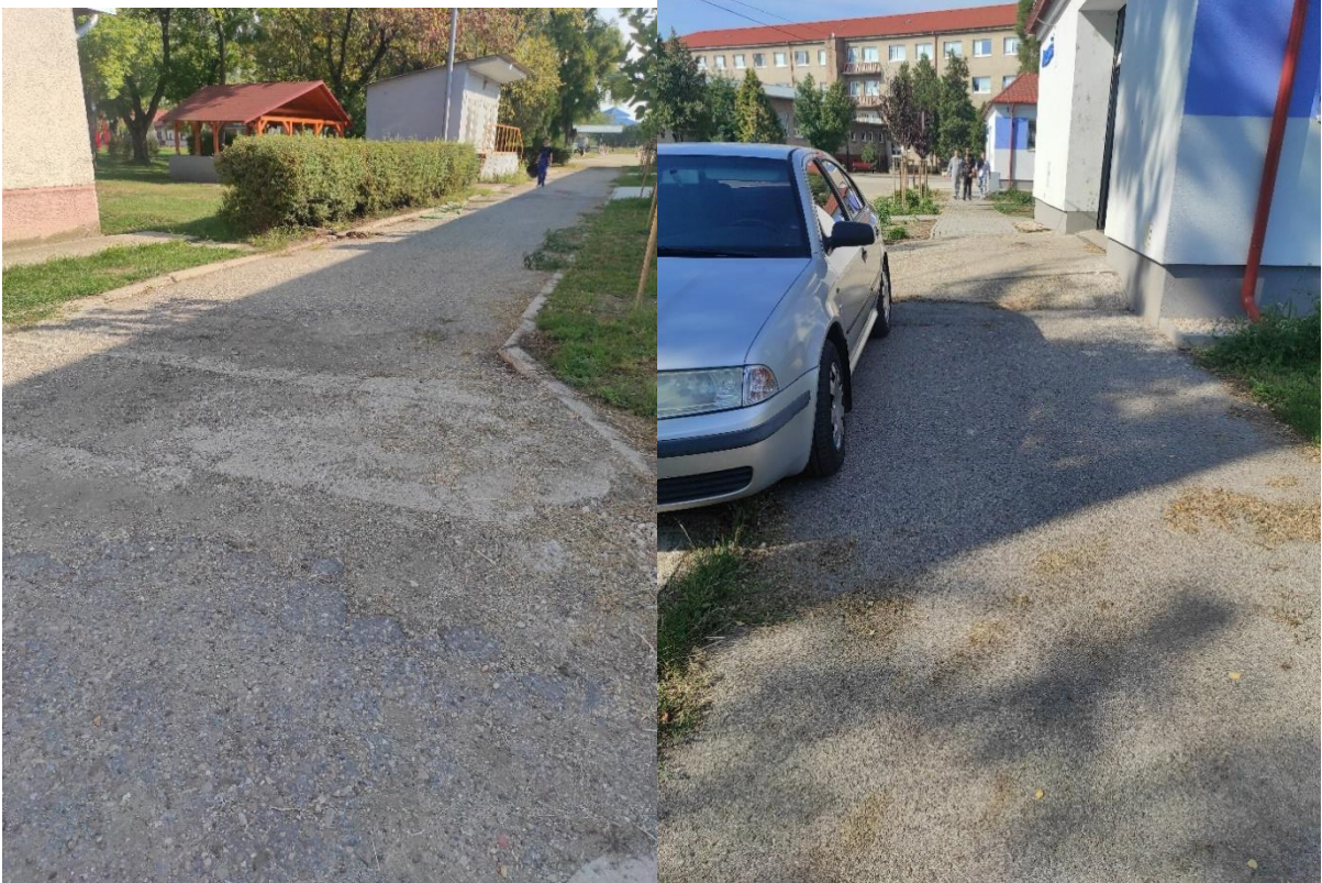
Výškové rozdiely v školskom areáli

Bezbariérové učebne, laboratóriá, dielne: