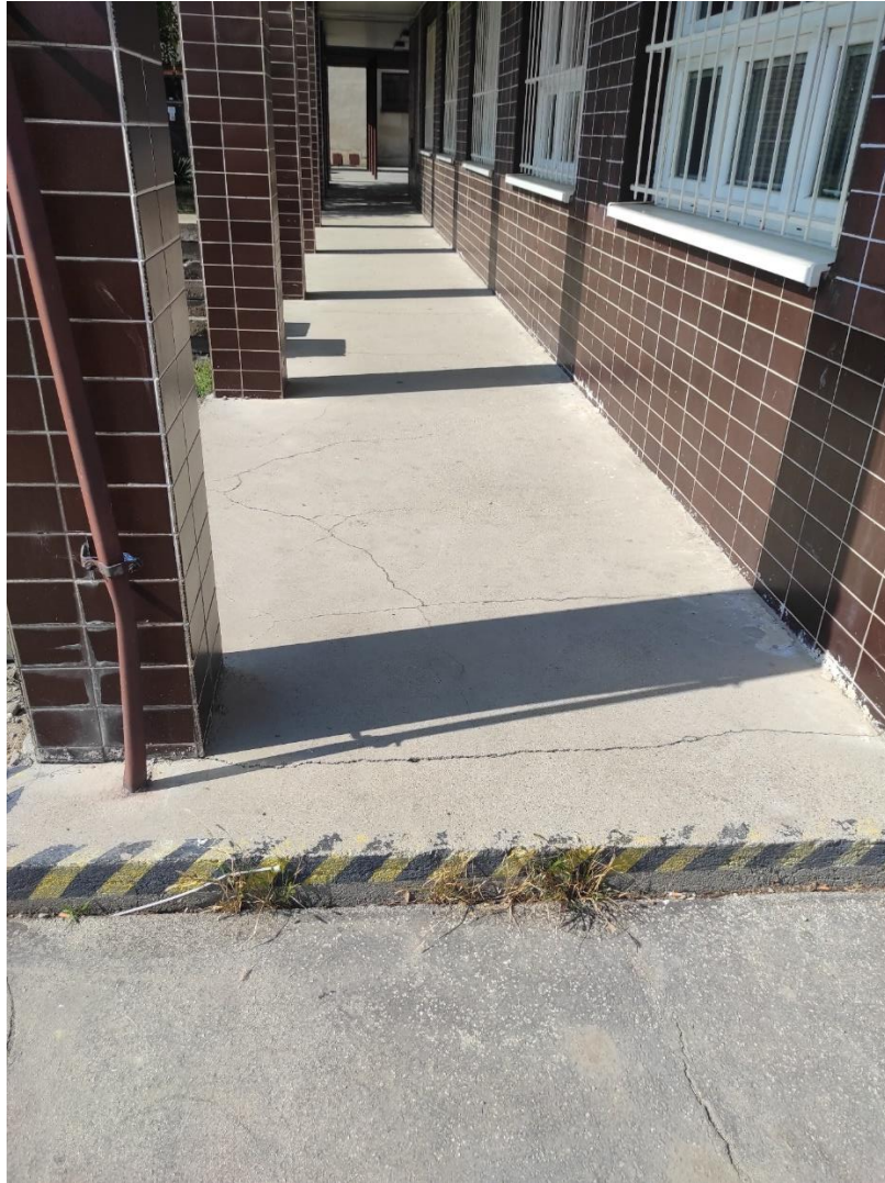
Výškový rozdiel na trase k „Športovisku“