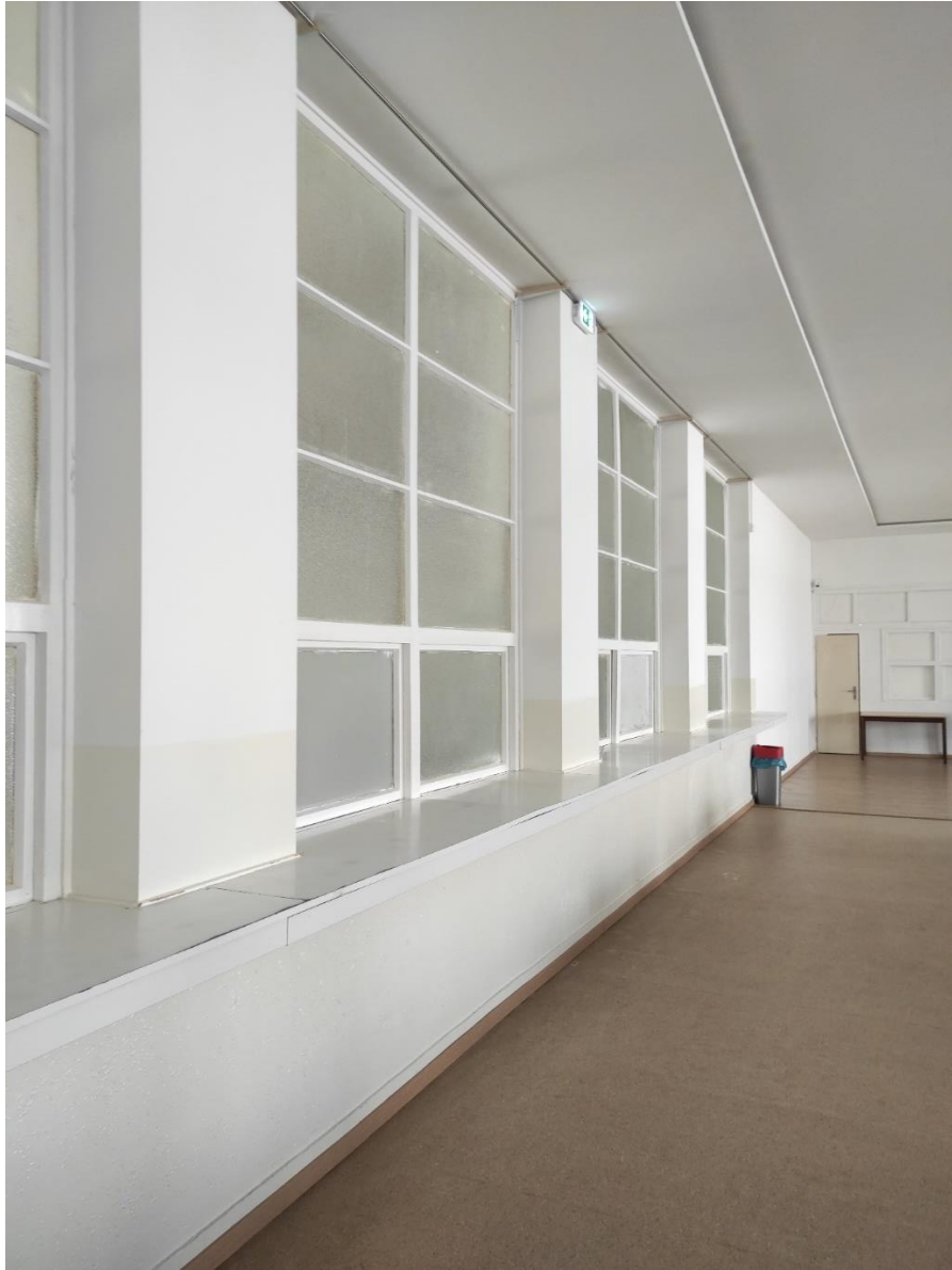
Pult na výdaj jedál nachádzajúci sa v jedálni