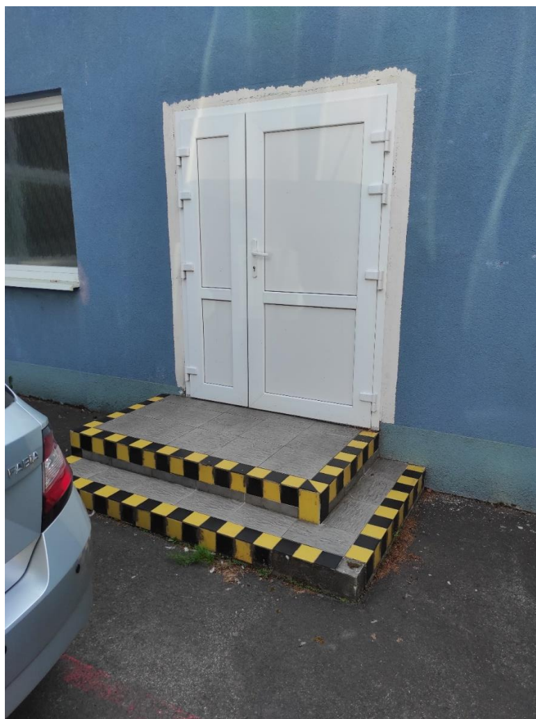
Bočný vstup do budovy – plánovaný bezbariérový vstup do „Budovy č. 1“