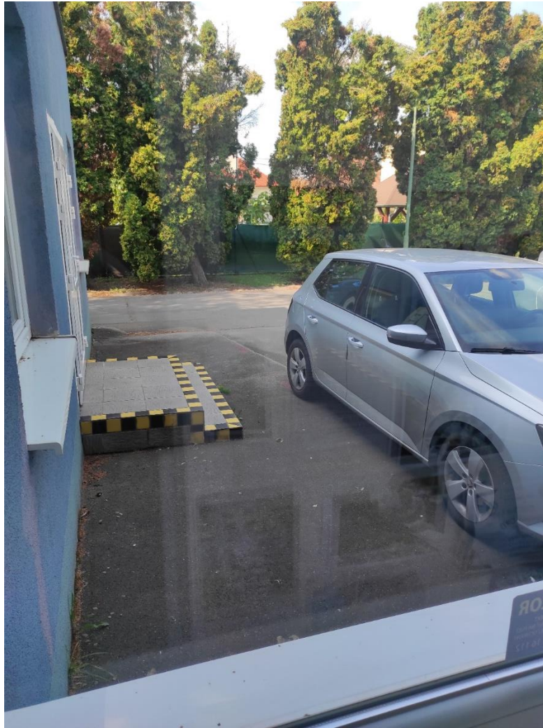
Bočný vstup do budovy a miesto pre bezbariérové parkovanie