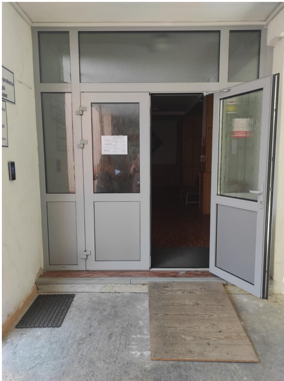
Hlavný vstup do „Budovy č. 3“