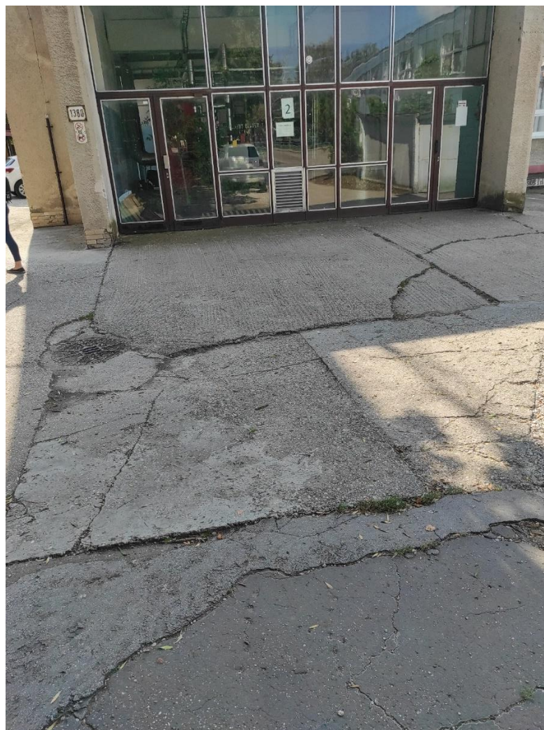
Potrebná úprava asfaltu chodníka na trase k „Budove č.2 – Sekretariát“