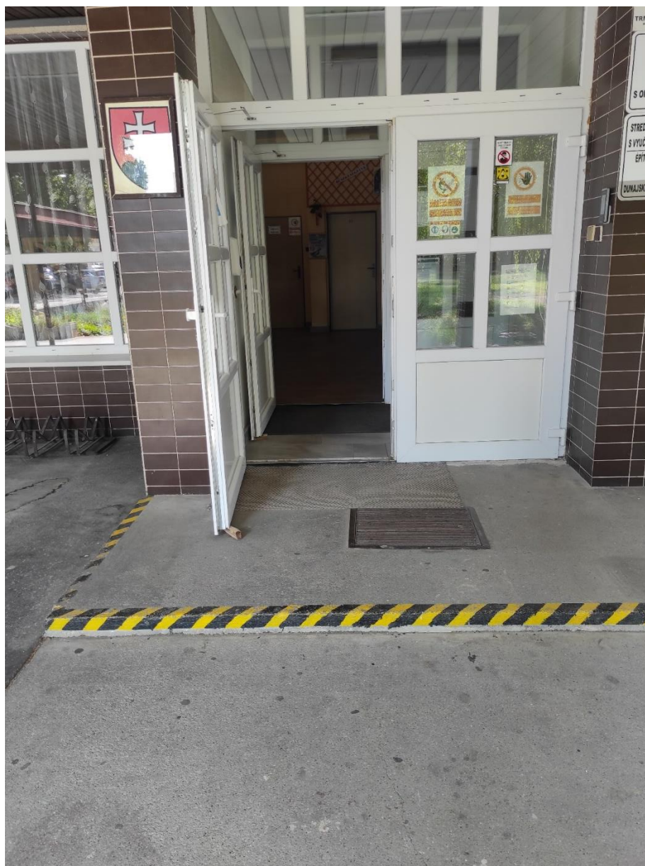
Hlavný vstup do „Budovy č. 2 – Sekretariát“