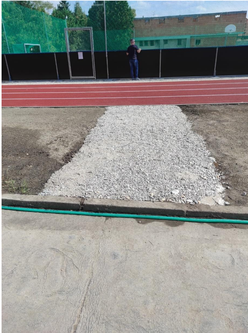
Výškový rozdiel a štrkový násyp v mieste, kde sa má zabezpečiť chodník