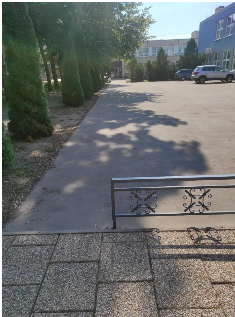
Výškový rozdiel na chodníku na trase k „Budove č.2 – Sekretariát“