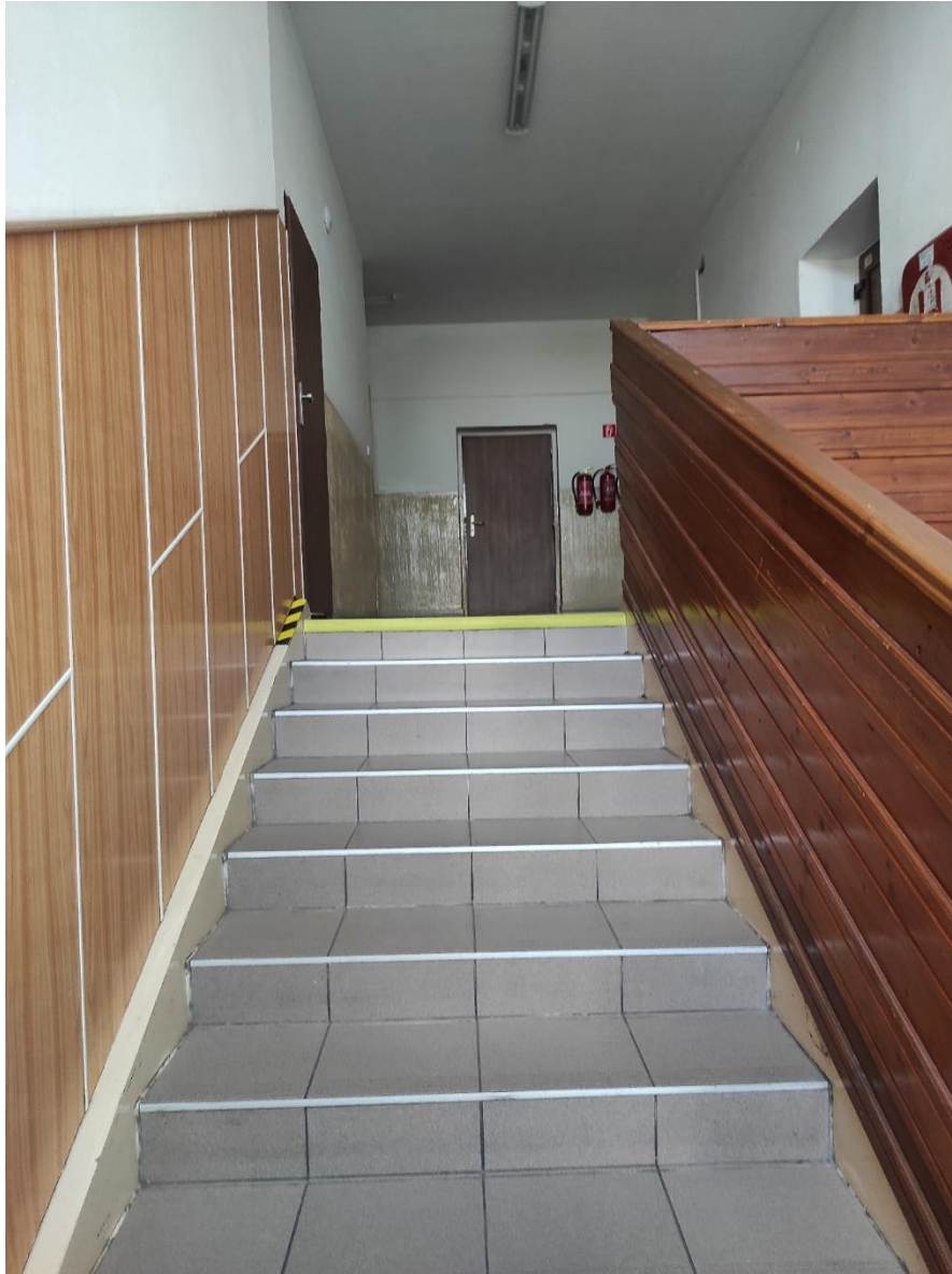
Schodisko – pohľad z podesty na 1. poschodie