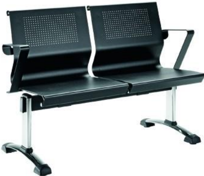
FOTO a technicky vykres k laviciam Aria