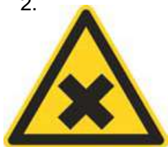
Nebezpečenstvo škodlivej alebo dráždivej látky