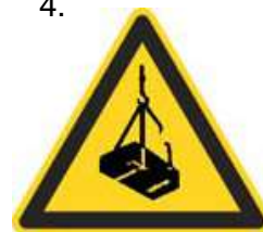
Nebezpečenstvo pádu alebo pohybu zaveseného bremena