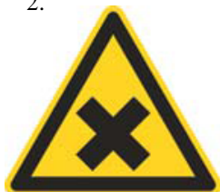
Nebezpečenstvo škodlivej alebo dráždivej látky