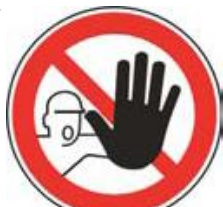
Nepovolaným vstup zakázaný (spolu so značkou č.2, 3 alebo 4 a príslušnou dodatkovou tabuľou)