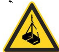
Nebezpečenstvo pádu alebo pohybu zaveseného bremena