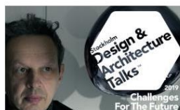
Stockholm Design & Architecture Talks