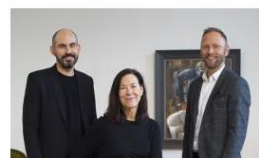
Bukowskis Born Classic