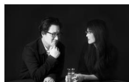
Neri&Hu - Guest of Honour 2019

Príloha č. 2: Záverečná správa o účasti na medzinárodnom odbornom podujatí