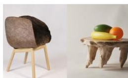
Diversity and awareness in Greenhouse