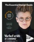
Out now! The Essential Design Guide