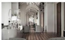
Exhibition - NM & A New Collection