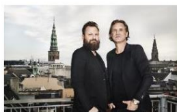
Greenhouse bar and exhibition