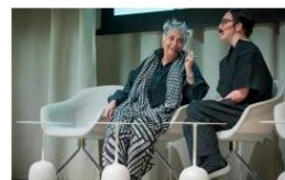
Challenges for the future