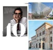
10 Architect Landmarks in Stockholm