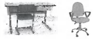
Katedra Dany, katedra ako na obrázku, zásuvky budú 3 kusy. Rozmery podľa požiadaviek, stolička Pioneer chrom.