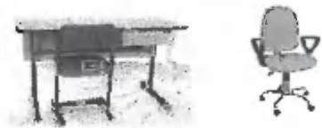
Katedra na notebook, pevný variant nie je v skopone, stôl je katedra bezúhľová ako na obrázku Dany, nián uzamykateľná zásuvka a nastavenie výšky stoličky na žiacku.