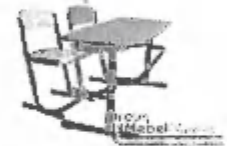
Stôl Dany, kniha nie navrhovaná, výškovonastaviteľná, pevná doska bezúhľová umakart. Zo zadu bude lišta: doska na prekrytie káblov ako na stole ESO.